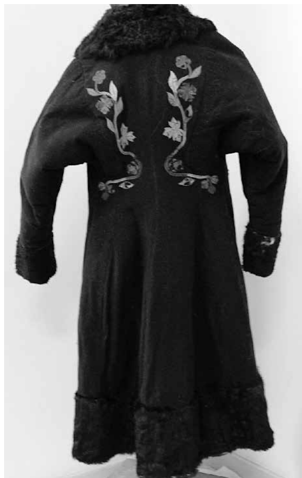
Рис. 6. Кызыльская шуба.