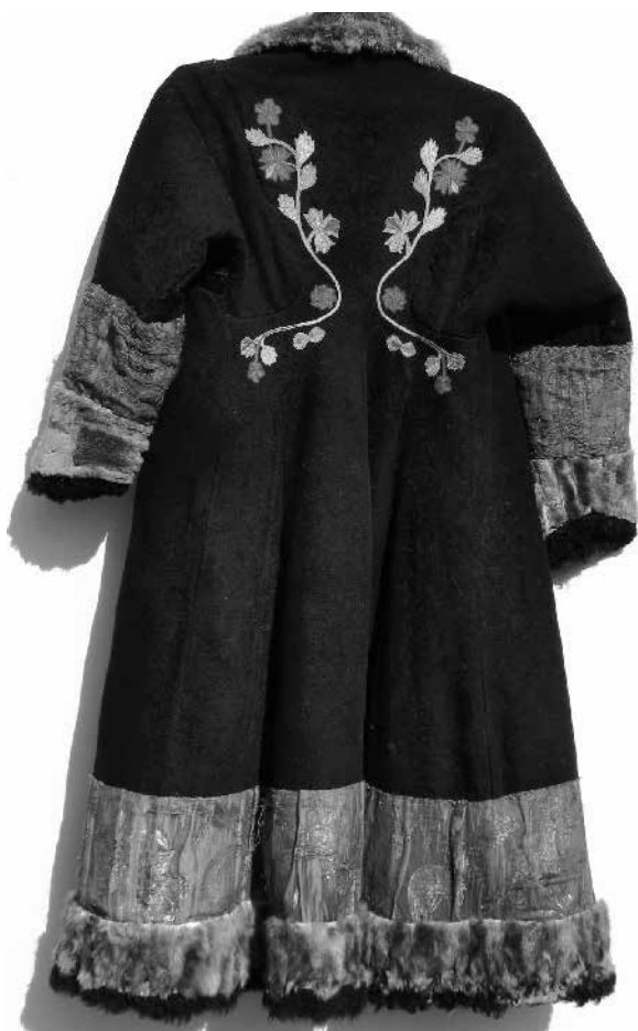
Рис. 5. Сагайская шуба.