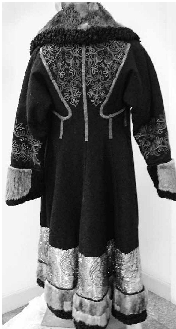
Рис. 7. Койбальская шуба.

Мотив орнамента вышивки «мировое дерево» делался по определенному канону с сохранением строго традиционных форм. Орнаментальные мотивы, украшающие вышивку, сводятся к сильно стилизованным элементам растительных очертаний, нередко напоминающим по форме растительные побеги. В хакасской народной вышивке орнаментальный мотив «мирового дерева» был очень популярен на женских шубах, на сикпенах, на рукавицах и на кисетах. Мотив «мирового дерева» являлся не чем иным, как изобразительным следом двух широко распространенных в тенгрианстве культов: «Богини-Матери» и деревьев. Еще со времен матриархата плодородная сила Земли олицетворялась в образе женского божества, и столь же древним является ее символическое изображение в виде различных форм растительности. Так же изображалось и священное «дерево жизни», источник жизненной силы, символ плодородия, вместилище души предков. Эти два предмета почитания и благоговения наших предков получили в народном искусстве один условный изобразительный знак «мировое дерево». Мотив «мирового дерева» является стержнем трехчастной композиции, сюжетный смысл которой некогда мог означать сцену поклонения симме-