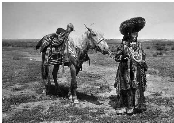
Рис. 4. Шуба идектиг тон.

Божество Тенгри, являясь главой хакасского пантеона, предопределяет судьбы людей, сроки их