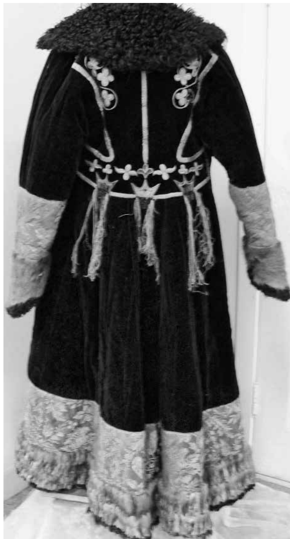
Рис. 9. Качинская шуба.

н. э.) были установлены в степи, в горах, около рек, озер и лесов, где в честь него совершались жертвоприношения. Богу Среднего мира «Чир-Су» (Земля-Вода) подчинялись все духи – хозяева местностей гор, тайги, рек и озер.