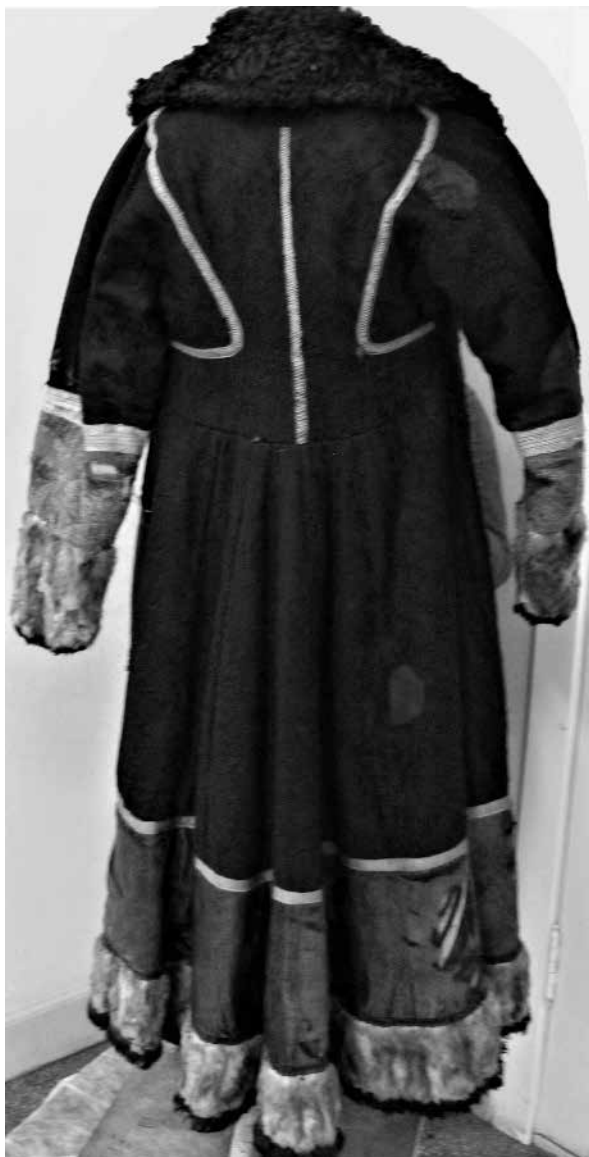
Рис. 8. Шорская шуба.