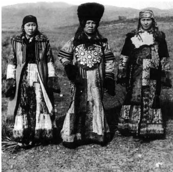
Рис. 2. Праздничные шубы.

Особенность праздничной шубы состояла в том, что «хачы» делали только качинцы, сагайцы, шорцы и койбалы, а кызыльцы «хачы» совсем не делали.