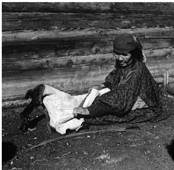
Рис. 1. Выделка овчины.

В 1770 г. ученым П. С. Палласом была впервые описана технология обработки шкур для шитья шубы. Он сообщил: «По большей части делают оные (шубы. – М. Ч.) из кож диких коз, кои бабы приготавливают разварившейся звериною печенкою в сутки и умеют оную выделывать зубчатую скребницею на кольнях мягкою» [4, с. 460–461].