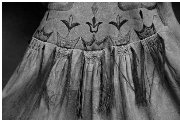
Рис. 10. Праты и тартхань на шубе.

В Петербурге в Музее антропологии и этнографии им. Петра Великого (Кунсткамере) сохранилась такая женская шуба из улуса Тугужеков, где неиз-