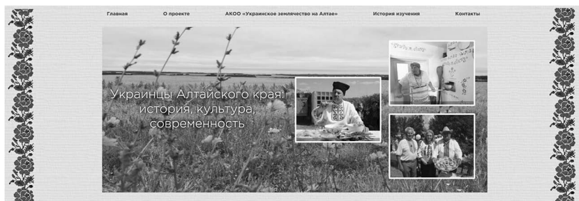
Рис. 2. Информационные блоки. Главная страница информационного ресурса «Украинцы Алтайского края: история, культура, современность».