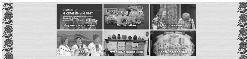
Рис. 3. Разделы. Главная страница информационного ресурса «Украинцы Алтайского края: история, культура, современность».

Главной целью открытого информационного ресурса является обеспечение доступа носителям украинской культуры и всем интересующимся к информации об истории, культуре, современных процессах в среде украинского населения Алтайского края, а также создание условий для изучения, сохранения, популяризации истории и культурных традиций для успешной социальной адаптации молодежи – носителей украинской культуры – и воспитания толерантности среди населения разных национальностей нашего региона. Интернет-ресурс «Украинцы Алтайского края: история, культура, современность» обеспечит открытый доступ для украинцев, украинской молодежи и широкой общественности к данным материалам в форме качественного контента.