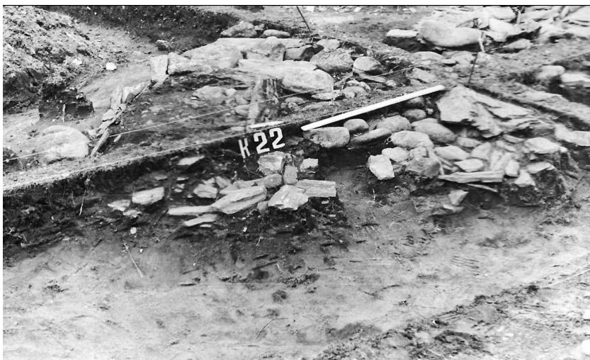
Рис. 2. Наземная конструкция кургана № 22 некрополя Карбан I. Вид с юго-востока.

ты керамики без орнамента. Недалеко от юго-западной стенки ящика в почвенном слое найдены «бабка» и обломок большой берцовой кости лошади.