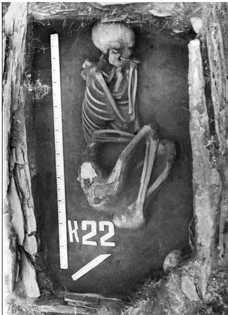
Рис. 4. Захоронение человека в каменном ящике кургана №22 некрополя Карбан I.

гильной яме, подбой, положение умерших на спине, ориентировка в восточный сектор горизонта и др.).