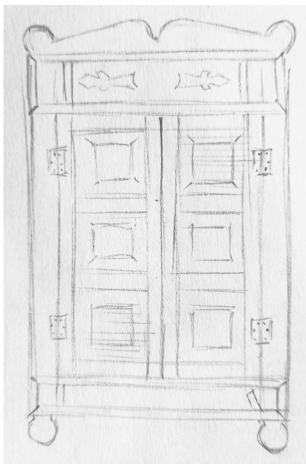
Рис. 3. Наличник дома в с. Усть-Волчиха Волчихинского района. Рисунок Г. Л. Гаманович. 2022 г.

К началу 1940-х гг. вышеуказанные формы производства сохранялись. И если пимокатное ремесло существовало открыто и носило ремесленный характер, то выделкой кож занимались в домашних усло-