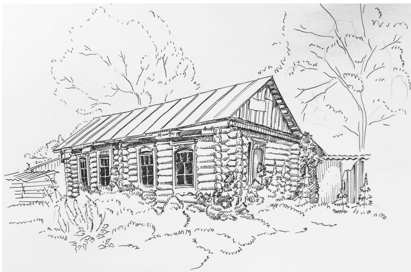
Рис. 1. Дом в с. Новокормиха Волчихинского района. Рисунок Г. Л. Гаманович. 2022 г.

«Малые коренные народы Алтайского края. Кумандинцы» (Красногорский район), «Депортация и адаптация немцев на Алтае» (Волчихинский район). Поскольку коллекции музея призваны отражать не только прошлое, но и настоящее районов края, был проведен сбор материалов по темам «Крестьянско-фермерские хозяйства», «Предприятия пищевой промышленности в районах Алтайского края».